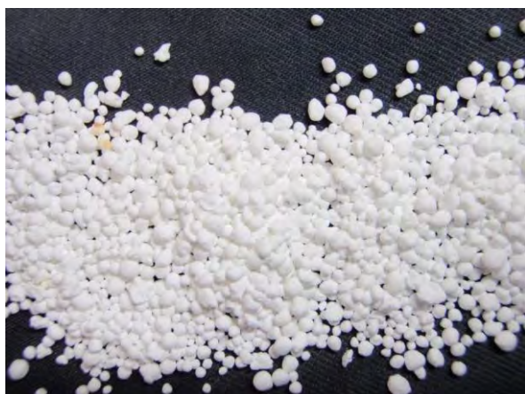
▲ イソブチルアルデヒド縮合尿素(1), 現物