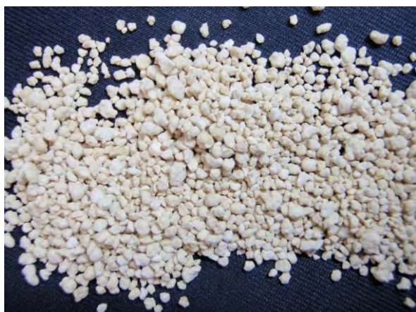
▲ アセトアルデヒド加工尿素肥料(1), 現物 白色結晶性で吸湿性が低く水への溶解度も低い。