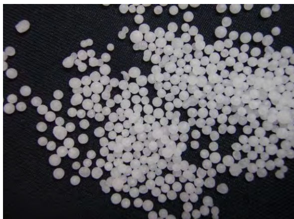
▲ 尿素(1), 現物 白色無臭の結晶で水に溶けやすく吸湿性が高い。