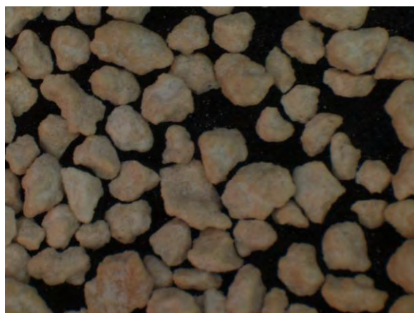
▲ アセトアルデヒド加工尿素肥料(1), 実体顕微鏡(10倍)