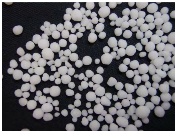
▲ 尿素(2), 現物